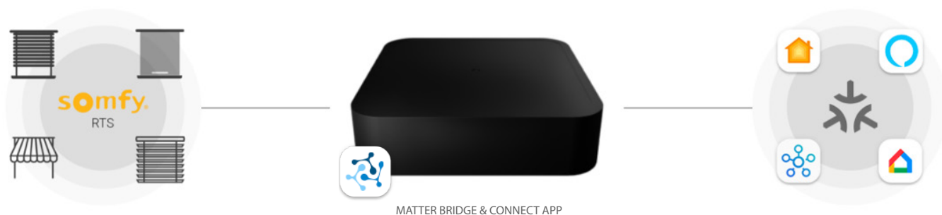
MATTER SMART HOME PLATTFORMEN